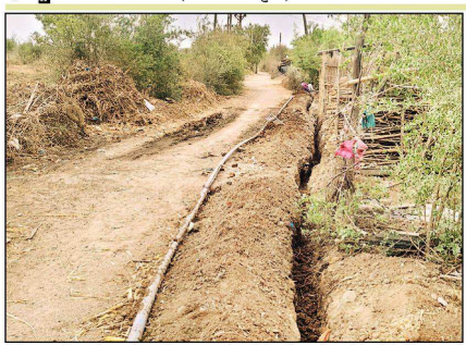
નેત્રંગ નગરમાં નલ સે જલ યોજના હેઠળ નાખવામાં આવેલી પાઈપ લાઈન કાઢીને કરીથી ઊંડે નાંખવાને કામગીરી કરવામાં આવી રહી છે.