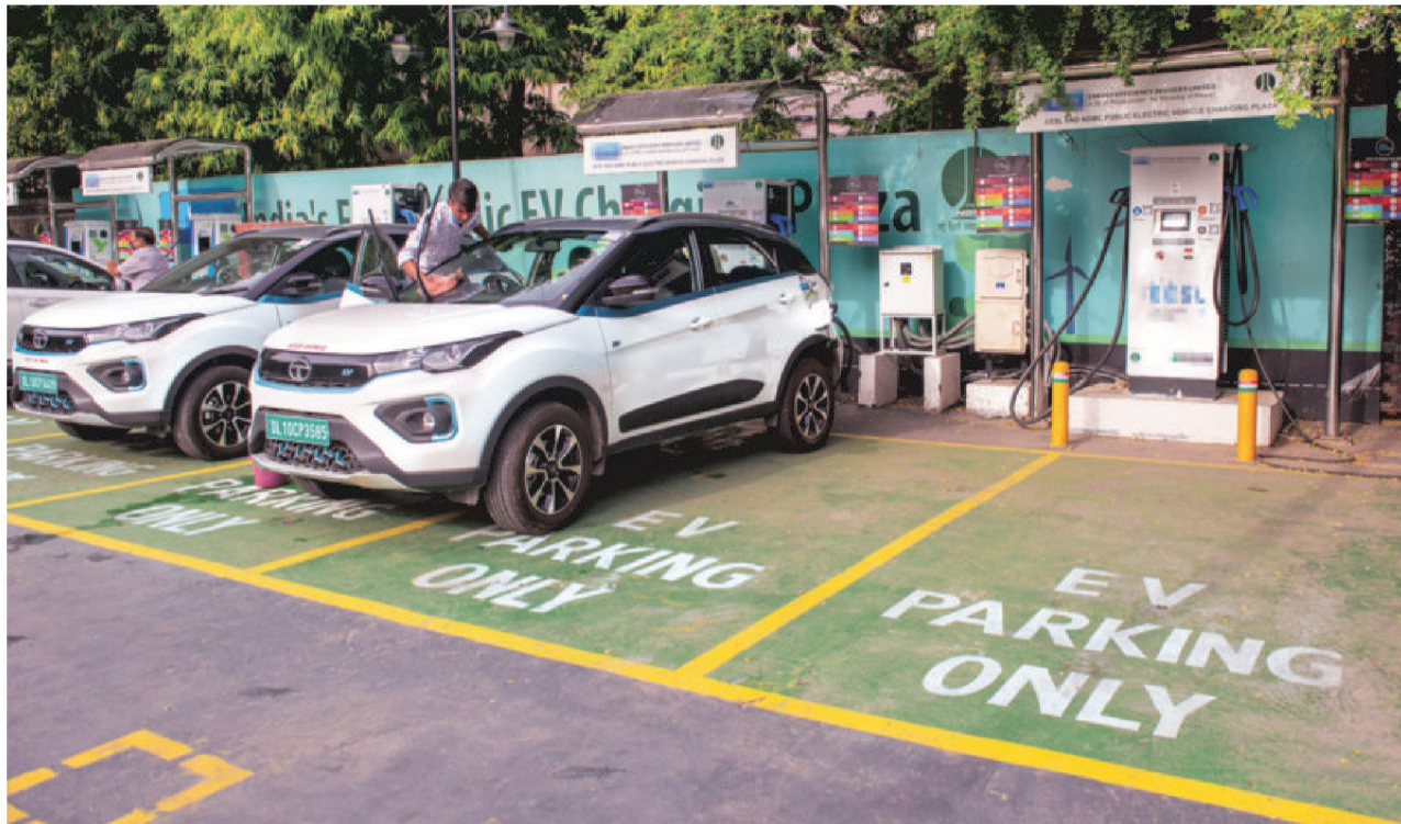
GIVE WAY: India currently has a ratio of one charger for every 13 cars, a contrast to China's ratio of one charger for every four cars

Another hurdle in the realm of public charging is the scarcity of fast charging options. According to an analysis by NRI Consulting and Solutions, a mere 20 per cent of