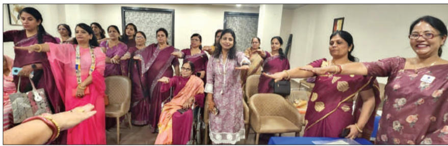
मतदाता जागरूकता कार्यक्रम में शपथ लेती लक्ष्मण क्लब शोरी की सदस्यिकाएं।