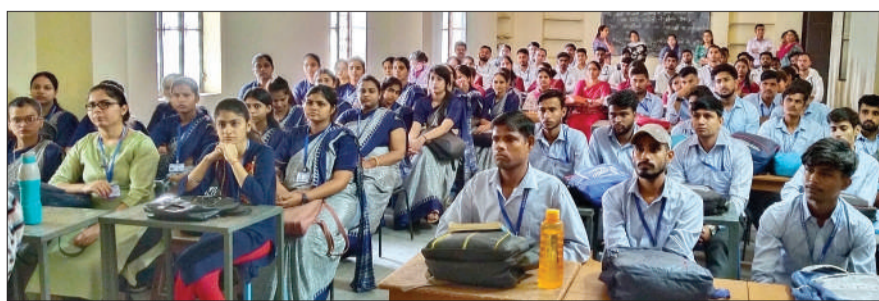
एसएस राठौर महाविद्यालय में आयोजित मतदाता जागरूकता शिविर में भाग लेते विद्यार्थी।