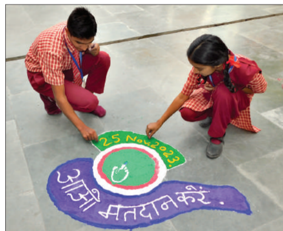
राघव पब्लिक स्कूल के विद्यार्थियों ने रंगोली बनाकर दिया संदेश।