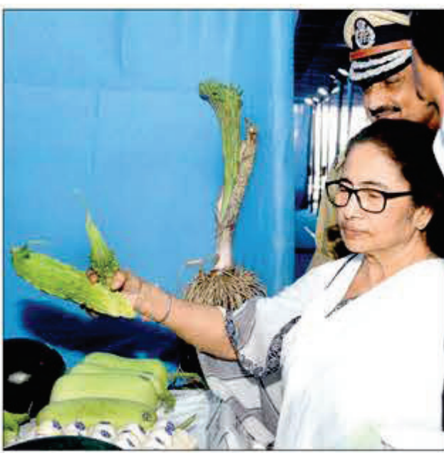
প্রশাসনিক বৈঠকে যোগ দিতে আসার আগে পুরুলিয়ায় স্বনির্ভর গোষ্ঠীর মহিলাদের থেকে সবজি কিনছেন মুখ্যমন্ত্রী।

এদিনের প্রশাসনিক সভায় জানান মুখ্যমন্ত্রী।