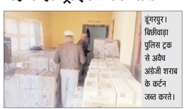
डूंगरपुर। बिछीवाड़ा पुलिस ट्रक से अवैध अंग्रेजी शराब के कर्टन जब्त करते।

डूंगरपुर (प्रातःकाल संवाददाता)। मूंगफली की आड़ में अवैध शराब की तस्करी का खेल सामने आया है। सड़क पर ट्रक अनियंत्रित पलट गया। शराब की बोतलें सड़क पर बिखर गईं। पुलिस ने करीब 302 पेटी बरामद की गईं। हादसे में ड्राइवर की मौत हो गई।