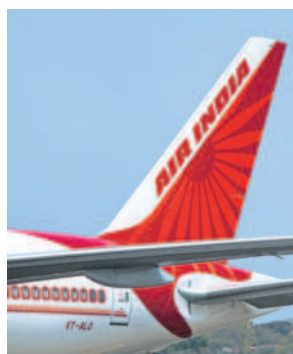
The government hopes to privatize Air India by the end of the current fiscal.

Due to the prevailing situation, Tata Sons is considering a lower valuation for Air India and is likely to urge for a higher absorption of the airline's debts by the Centre. Air India has around $10 billion worth of debts, of which Tata Sons may ask the government to take care of more than $5 billion.