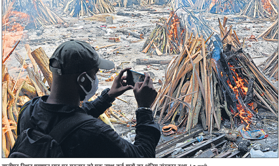
गाजीपुर स्थित श्मशान घाट पर गुरुवार को एक साथ कई शवों का अंतिम संस्कार हुआ।