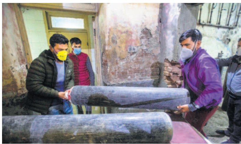
Consultancies like EY India have been assisting states to rapidly develop digital platforms for ensuring oxygen supply to covid-19 patients.

"We are bound by confidentiality obligations and are unable to comment on client-specific matters," a Deloitte spokesperson