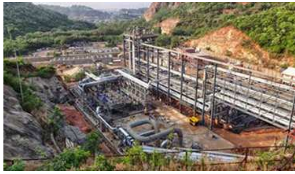
A view of ISPR facility in Visakhapatnam

The pricing was based on a landed cost of crude oil at Visakhapatnam, which was derived from the official selling price (OSP) of Iraq's national oil company, State Organization for Marketing of Oil (SOMO), for Basra Medium crude oil grade. The estimated landing cost was calculated at around $84.57 a barrel. The payments have to be made by May 2023.