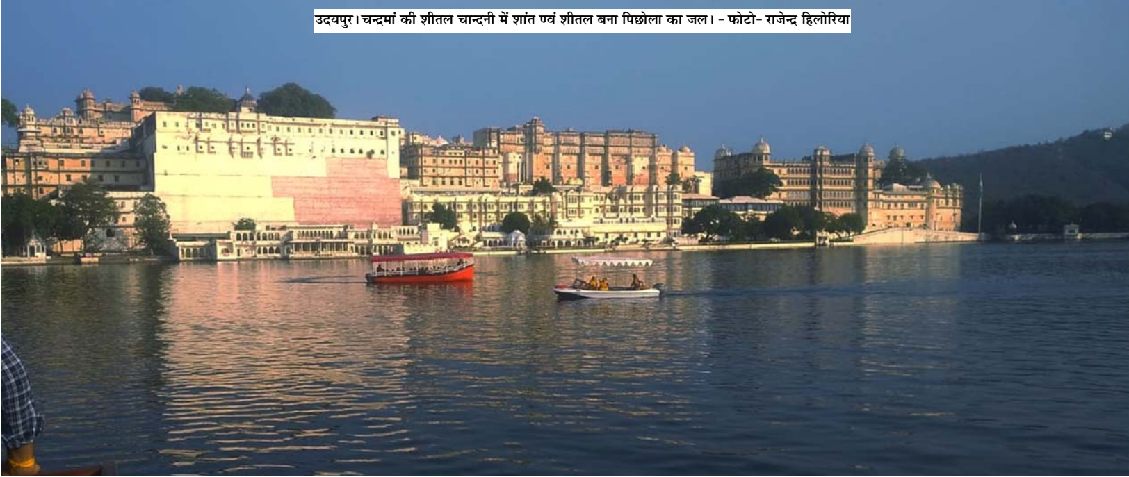
उदयपुर। चन्द्रमा की शीतल चान्दनी में शांत पर्व शीतल बना पिछोला का जल।

दिनांक: 16 नवम्बर 2024 -भूपेन्द्र कुमार चौबीसा, उदयपुर