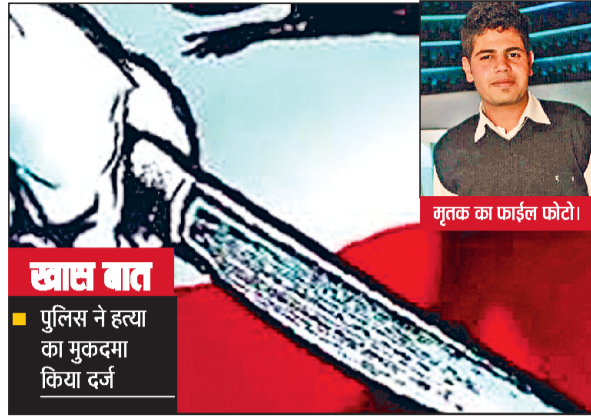
स्वासा बात पुलिस ने हत्या का मुकदमा किया दर्ज