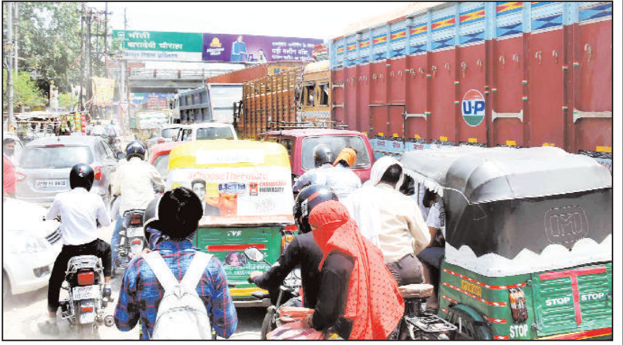
यशोदानगर व जूही हमीरपुर रोड पर लगा भीषण जाम

जिससे जाम ने नौबस्ता से यशोदानगर और बारा देवी से जूही हमीरपुर रोड व बरा देवी पास को भी अपनी चपेट में ले लिया और देखते ही देखते वाहनों की लम्बी कतारें लग गयीं। जिसके चलते वाहनों की रफ्तार थम गयी और वह रेंगरेंग कर निकलने लगे। इस दौरान यशोदानगर बाई पास पर रामादेवी की ओर से आ रही एक एम्बुलेंस फंस गयी। यह देख वहा मौजूद दो यातायात सिपाहियों ने किसी प्रकार एम्बुलेंस को जाम से निकलवाया। जाम का विकाराल रूप देख नौबस्ता जूही व बरा देवी पास को नौबस्ता से रामादेवी जाने वाले हाईवे पर जाम लग गया। जाम से निकलने के लिये वाहन सवार आड़ा तिरछा निकलने लगे।