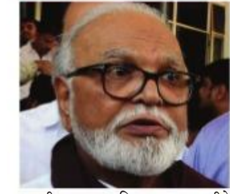
नागरी पुरवठा विभागाच्या वतीने विविध योजना राबवण्यात येत असून अन्नधान्याचे वाटप करण्यात येत आहे.