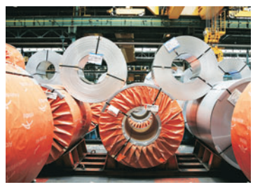
chain, which has completely collapsed, needs to be reconstructed for a significant pick-up in demand. ArcelorMittal Nippon Steel India

Typically, construction accounts for 60-62 per cent of end-use and auto 15-16 per cent. The demand that is coming back is mostly from auto components, fabricators and some government projects, said steel producers. But they pointed out that it's not just a restart of activity at the end-user level that is required; the value