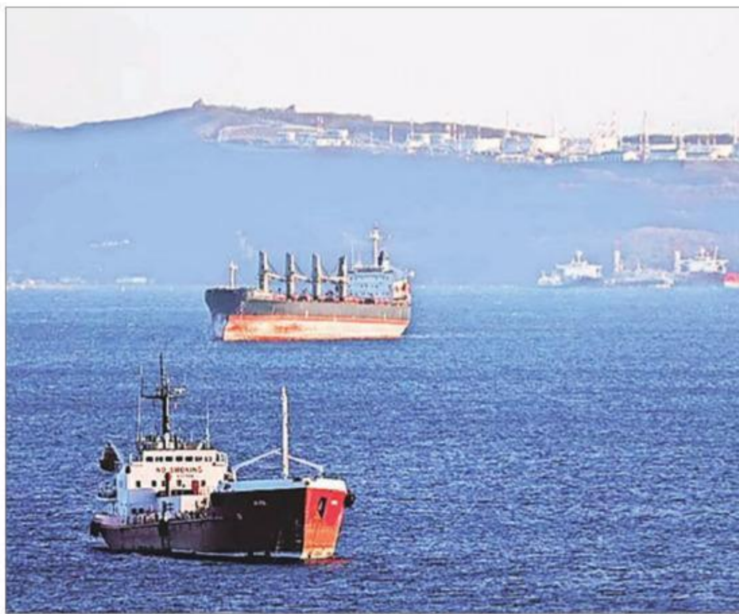
Russia is India's largest source of crude as Moscow accounted for over 35% of New Delhi's oil imports in 2023

The opaque tanker fleet refers to vessels involved in Russian, Iranian, and Venezuelan crude oil and petroleum products trade. With Western fleet operators loath to get involved in the oil trade of these countries due to sanctions of varying degrees, operators from countries like Greece, Russia, and China, and tax havens like Marshall Islands, Liberia, and Panama have emerged as the major players. The oil and gas industries of Russia, Iran, and Venezuela have been under