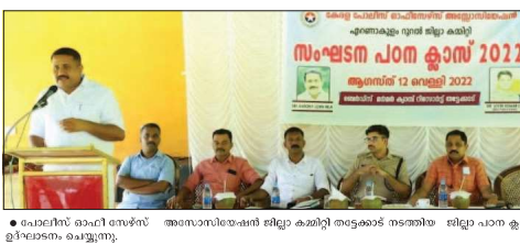
പോലീസ് ഓഫീസ് അസോസിയേറ്റ് ഷർ ജില്ലാ ക്യാമ്പ്

വീവരാവകാശ മരുപ്പി നൽകിയില്ല കൂസാറ്റ് അധികൃതർ ഹർജിക്കാരന് 5000 രൂപ നഷ്ടപരിഹാരം നൽകാൻ വീഡി. വീവരാവകാശ മരുപ്പി നൽകിയില്ല.