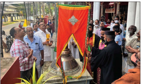
കണ്ടനാട് കത്തിശ്രദ്ധിത പെരുന്തൻ കോടിയേറി