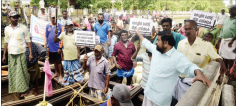
മിസ്സിയുടെ ജോലി വാഗ്ദാനം ചെയ്ത് അഞ്ച് ലക്ഷം തിരി പിടിയൽ

പിറവതൻ മത്സരവള്ളം കളിയിൽ ആവരണമേൽക്കാൻ ചെറുപുഴയിൽ. പിറവതൻ മത്സരവള്ളം കളിയിൽ.