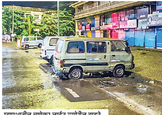
म्हापशातील चणेकर लाईन समोरील वाहने.

लोकमत न्यूज नेटवर्क म्हापसा : म्हापशात भंगार व बेवारस स्थितीत सोडण्याचे प्रकार अलीकडे वाढले आहेत. शहरातील काही भागात वापरात नसलेली, गजलेली पूर्णपणे निकामी झालेली वाहने दुर्लक्षीत अवस्थेत पार्क केली जात आहेत. त्यातील काही वाहनांचा वापर विक्रेत्यांकडून सामान ठेवण्यासाठी गोदाम म्हणून केला जात आहे, तर काही वाहने दुर्लक्षित झाल्याने ती गजत आहेत.