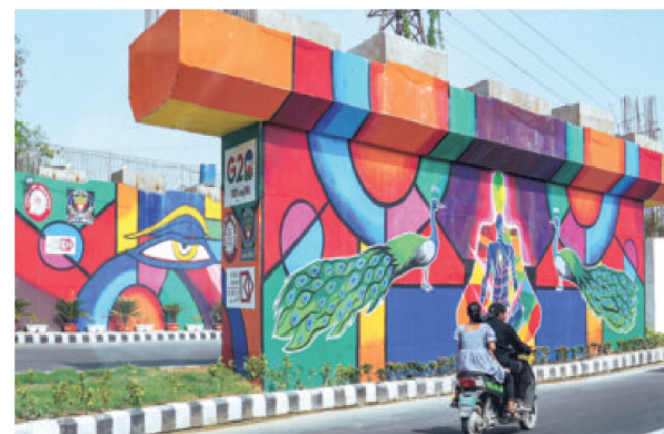
Commuters pass by a mural designed in preparation for the G20 Summit near Pragati Maidan in Delhi

Later, the spouses will proceed to Jaipur House at India Gate, home to the National Gallery of Modern Art (NGMA), to