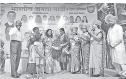
यावेळी कोकणातील सांस्कृतिक कार्यक्रमांसाठी 'दशावतार' या नाटकातील कलाकारांचा सत्कार करून उत्कृष्ट सादरीकरणबद्दल प्रमाणपत्र देऊन गौरविण्यात आले.