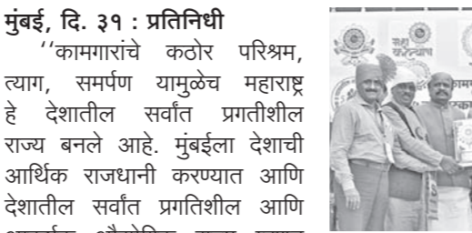
मुंबई, दि. ३१ : प्रतिनिधी "कामगारांचे कठोर परिश्रम, त्याग, समर्पण यामुळे महाराष्ट्र हे देशातील सर्वात प्रगतीशील राज्य बनले आहे. मुंबईला देशाची आर्थिक राजधानी करण्यात आणि देशातील सर्वात प्रगतिशील आणि आकर्षक औद्योगिक राज्य म्हणून महाराष्ट्राची प्रतिमा निर्माण करण्यात कष्टकरी कामगारांचा सिंहाचा वाटा आहे," असे प्रतिपादन राज्यपाल रमेश बैस यांनी केले. महाराष्ट्र कामगार कल्याण मंडळाच्या ३५ व्या 'गुणवंत कामगार पुरस्कार' वितरण सोहळ्यात ते बोलत होते.

३५ व्या गुणवंत कामगार पुरस्कारांचे वितरण एक आहे. आज महाराष्ट्र कामगार कल्याण मंडळामध्ये ५६ लाखांहून अधिक कामगार नोंदणीकृत आहेत. विद्यमान कल्याण आयुक्तांच्या देखरेखीखाली कामगारांच्या कल्याणासाठी विविध भरीव कामे करण्यात आल्याचे दिसते," असे समाधान राज्यपालांनी व्यक्त केले.