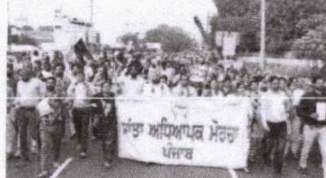
ਪੱਕੇ ਮੋਰਚੇ 'ਚ ਇਕੱਠੇ ਹੋ ਕੇ ਪਟਿਆਲਾ ਵਿਖੇ ਸਰਕਾਰ ਨੂੰ ਯਾਦ ਕਰਵਾਏ ਵਾਅਦੇ...