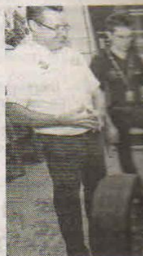
Britain's Prime Minister Boris Johnson at the University of Sunderland.

Britain officially departs the EU at 11 pm local time Friday, midnight in Brussels (2300 GMT, 6 pm EST). The departure comes 3½ years after the country voted by a margin of 52%-48% to walk away from the club that it had joined in 1973. It's the first time a country has left the EU, and many in the