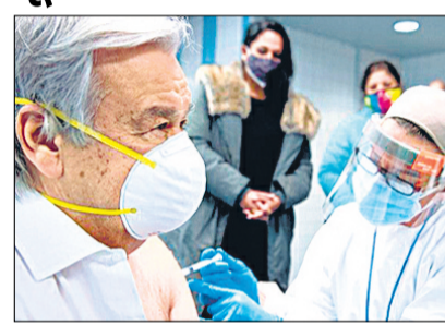
संयुक्त राष्ट्र महासचिव एंतोनियो गुतारेस ने गुरुवार को कोविड-19 टीके की पहली खुराक लगवाई।

'मैं आज कोविड-19 टीके की पहली खुराक लगवाकर खुद को बहुत सौभाग्यशाली महसूस कर रहा हूँ। हमें यह सुनिश्चित करने के लिए काम करना चाहिए कि टीका हर जगह, सभी के लिए उपलब्ध हो।'