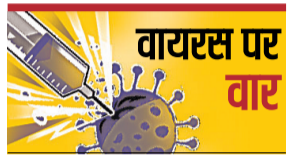
नई दिल्ली/वाशिंगटन