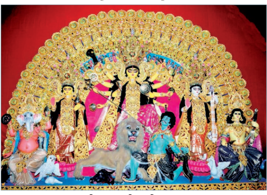
বড়িশা কর্নারের প্রতিমা।

হবে সমস্তরকম স্বাস্থ্যবিধি। মানা হবে সামাজিক দূরত্ব। কোনও বছরই তাঁরা যিমের পুজো করেন না। এ বছরেও করা হচ্ছে না। এবার তারা তৈরি করেছেন পুরনো একটা রাজবাড়ি। যেখানে করা হয়েছে থার্মোকানের কাজ। সৌরভদের