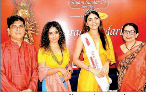
শারদোৎসবে শ্যামসুন্দর কোম্পানি জয়েলার্সের 'শারদ সুন্দরী পুরস্কার' এ বছর অষ্টম বর্ষে পড়ল।