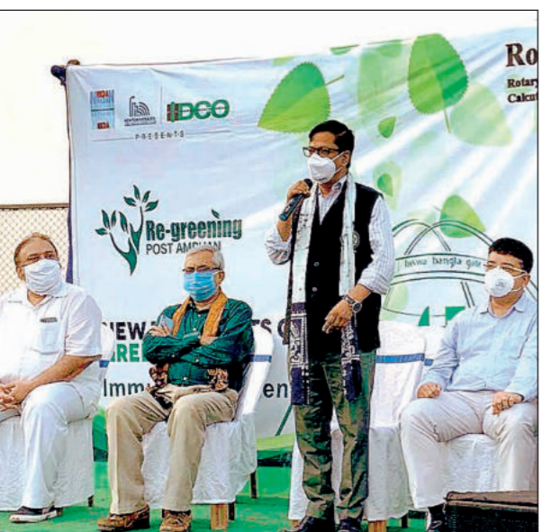
নিউ টাউনে ইকো পার্কের পেছনে ভেজ গাছের ইনিউনিটি গার্ডনে গড়ে উঠেছে। ভেজ গুণ সমৃদ্ধ ১২ রকমের গাছ সেখানে লাগানো হবে।

সিআইএন: L23109WB1960PLC024602 রেজিস্টার্ড অফিস: ৩১, নেতার্জি স্ট্রায়েট রোড, কলকাতা - ৭০০ ০০১ ফোন: +৯১ ৩৩ ৬৬২৫ ১৪৪৫, ফ্যাক্স: +৯১ ৩৩ ২২৪৫ ০১৪০/২২৪৫ ৬৬৬৮