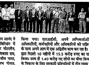
एलआईसी द्वारा लॉकडाउन हीरोज मोटरमेंटों का सम्मान किया गया।

मुंबई। वीथिक गवर्नर के रूप में पूरी दुनिया को एक उदाहरण में ला दिया, लॉकडाउन के दौरान हीरोज मोटरमेंटों का सम्मान किया गया।