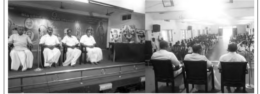
தாத்துக்குடியில் இந்து முன்னணி மாநில பண்பு பயிற்சி முகாம் தொடங்கியது.