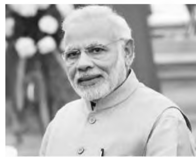
யில் தேசிய ஜனநாயகக் கூட்டணியில் அங்கம் வகிக்கும் கூட்டணி கட்சிகளின் தலைவர்களும் கலந்து கொள்கின்றனர்.

வாரணாசி, ஏப்.23: உத்தரப்பிரதேச மாநிலம், வாரணாசி மக்களவைத் தொகுதியில் போட்டியிடும் பிரதமர் நரேந்திர மோடி, அத்தொகுதியில் வரும் 26-ஆம் தேதி வேட்பு மனு தாக்கல் செய்கிறார். வாரணாசியில் மோடி 2-வது முறையாக போட்டியிடுகிறார். இதற்கான வேட்பு மனுவை அவர் வரும் 26-ந் தேதி தாக்கல் செய்கிறார். இதை யொட்டி வாரணாசியில் 25-ஆம் தேதி பிரம்மாண்ட பேரணி நடைபெற உள்ளது. இந்தப் பேரணி