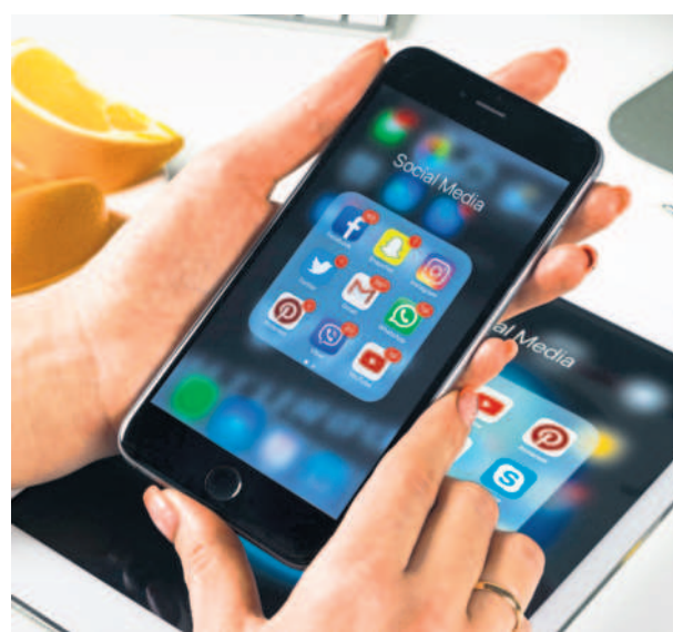
The report gives details on actions taken against content that violated norms.

Other categories of content violation on Facebook include hate speech, dangerous organizations and individuals, organized hate, terrorist propaganda, bullying, harassment, regulated goods such as drugs and firearms, and suicide and self-injury.