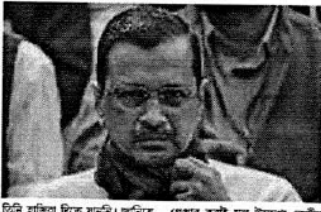
বিচার বিভাগীয় মুদ্রিত সাক্ষ্যে আমলাকর্তাদের আবেদনকে কেন্দ্র করে তালব করা হয়েছে।

নয়া দিল্লি, ১৪ ফেব্রুয়ারি: বিচার বিভাগীয় মুদ্রিত সাক্ষ্যে আমলাকর্তাদের আবেদনকে কেন্দ্র করে তালব করা হয়েছে। এই তালব করা হবে বিচার বিভাগীয় তালব হিসেবে।