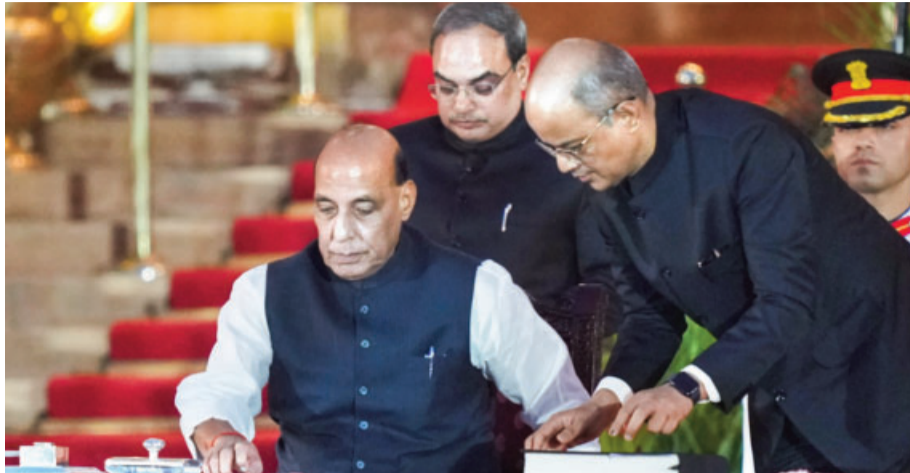
भाजपा में सफलता की सीढ़ी संघ है और राजनाथ सिंह का राष्ट्रीय स्वयंसेवक संघ से गहरा नाता है

संघ के साथ उनके बेहतर रिश्ते का अनुमान इस बात से लगाया जा सकता है कि आडवाणी के जिन्ना प्रकरण के बाद संघ ने सिंह को ही पार्टी के अध्याक्ष की जिम्मेदारी सौंपी थी। इसके बाद उन्होंने दूसरी बार पार्टी की कमान तब संभाली थी जब एक मामले में नितिन गडकरी का नाम सामने आया था। साधारण किसान परिवार में जन्मे सिंह ने मामूली कार्यकर्ता से लेकर पार्टी