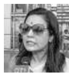
TMC leader Mahua Moitra

EXPRESS NEWS SERVICE NEW DELHI, NOVEMBER 7