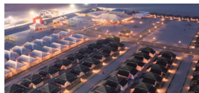
The tent city during the 2019 Ardhkumbh Mela in Prayagraj FILE PHOTO

According to the UP government, the tent city, illuminated with 67,000 streetlights, will comprise 2,000 tents and 25,000 public accommodations to serve the tourists. About 23,000 closed-circuit television cameras and an artificial intelligence-based chatbot system will complement the security detail for the temporary settle-