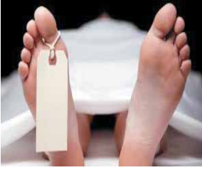
पायनियर समाचार सेवा। गाजियाबाद

टीला मोड़ इलाके में रविवार रात मां ने बेटी की तकिये से मुंह दबाकर हत्या कर दी। वारदात के बाद महिला ने पुलिस कंट्रोल रूम में फोन किया। कहा, मैंने अपनी बेटी का मर्डर किया है। मेरा एंड्रेस नोट कर लो। आकर लाश ले जाओ। इस कॉल के बाद पुलिस बताए हुए पते पर पहुंची।