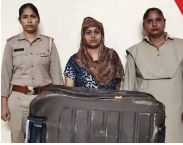
पायनियर समाचार सेवा। गाजियाबाद

● 4 साल से लिव-इन में रह रहे थे, शव ठिकाने लगाने के दौरान पकड़ी गई