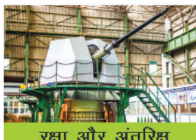
रक्षा और अंतरिक्ष