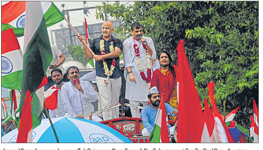
नोएडा स्टेडियम में बुधवार को आप पार्टी ने तिरंगा यात्रा निकाली। इसमें दिल्ली के उपमुख्यमंत्री मनीष सिसोदिया और सांसद संजय सिंह शामिल हुए। इससे पहले गंगा शॉपिंग कॉम्प्लेक्स में नेताओं ने कार्यकर्ताओं को संबोधित किया।

में पहले आपत्ति लगाई गई थी लेकिन कहीं सुनवाई न होने पर 2012 में इसके लेकर हाईकोर्ट में केस किया गया। 2014 में हाईकोर्ट ने इन टावरों को ध्वस्त करने के आदेश दिए, तब तक यह टावर 33 मंजिल बन चुके थे।