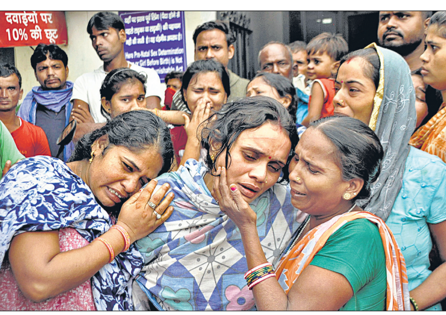
गाजियाबाद के नेहरू नगर में बुधवार को करंट से बचो की भीत के बाद परिजनों का रो-रोकर बुरा हाल हो गया। • हिन्दुस्तान

5. 30 दिन में पूरी होती है प्रक्रिया : कामजात में कोई कमी नहीं है तो यह मंजूरी अधिकतम 30 दिन के अंदर जारी कर दी जाती है।