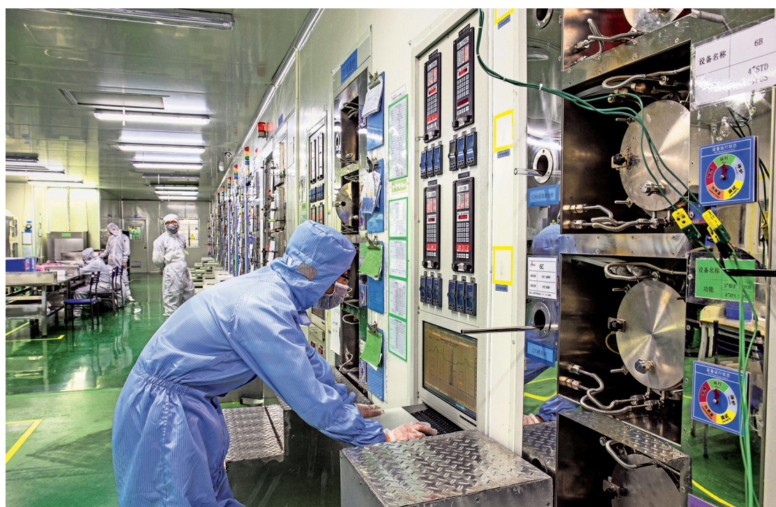
As more factories struggle to keep operations staffed, it is harder for buyers to source the products they need.

Factory activity across seven Southeast Asian countries also dropped in August from the previous