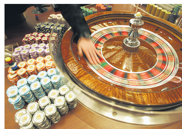
Macau's August gambling spending also fell by nearly half from July, after few residents tested positive for the delta variant.

Visitors now have to provide a negative covid-19 test from