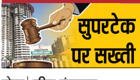
नोएडा | वरिष्ठ संवाददाता

सेक्टर-93 एस्थित सुपरटेक एमरॉल्ड सोसाइटी में अवैध रूप से बने दो टावर के मामले में शासन स्तर से कार्रवाई शुरू होने के बाद नोएडा प्राधिकरण में खलबली मची है। दोनों एसीईओ की अध्यक्षता में बनी कमिटी ने जांच शुरू कर दी है। इससे संबंधित दस अधिकारी-कर्मचारी की सूची बनाई गई है। इनमें तत्कालीन मैनेजर से लेकर दो सीएपी तक शामिल हैं। जिस सीईओ के कार्यकाल में मानचित्रों व एफएआर को मंजूरी दी गई, उनको भी शामिल किया जा रहा है। दो-तीन दिन में रिपोर्ट शासन को भेज दी जाएगी।