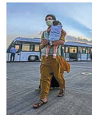
More than 123,000 people were evacuated from Kabul.

Taliban leaders have also called on Afghans to return home and help rebuild, while promising to protect human rights, in an apparent bid to