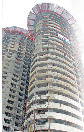
नोएडा प्राधिकरण में 2005 से 2012 तक ग्रुप हाउसिंग व नियोजन विभाग में तैनात अधिकारियों की

सुपरटेक एमरॉल्ड कोर्ट मामले में सुप्रीम कोर्ट ने जिस अफसर-बिल्डर गटजोड़ पर सख्त टिप्पणी की है, उसका खुलासा घर खरीदारों की सजगता से हो सका। पहले बिल्डर टपटर, फिर प्राधिकरण और वहां सुनवाई न होने के बाद हाईकोर्ट से लेकर सुप्रीम कोर्ट तक लड़ाई लड़ी गई।