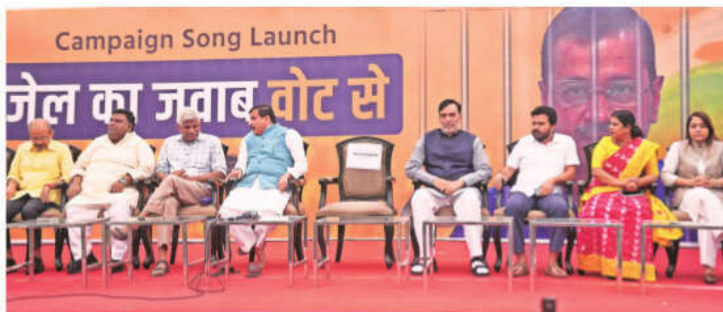
AAP leaders during the launch of the party's Lok Sabha campaign song in New Delhi on Thursday. A chair was kept empty for jailed party chief Arvind Kejriwal