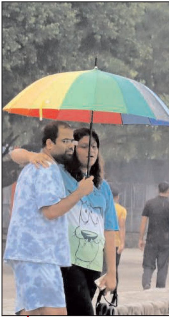
चंडीगढ़ में गुरुवार को बरसात ने गर्मी और उमस से राहत दी, जिसमें शहरवासी भीगते नजर आए। - कमलेश्वर सिंह