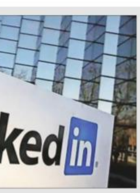
SECOND-LARGEST MARKET AFTER US

for India’s leaders, and ‘providing learning opportunities’ is their top solution for improving retention. Management, software development, SQL, communication, Java, leadership, engineering, analytical skills, Python and sales, were the 10 most in-demand skills in 2023, according to LinkedIn.