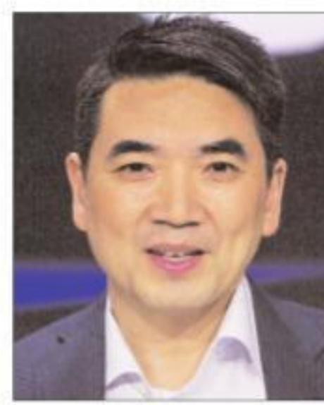
Eric Yuan, CEO, Zoom

CEO Eric Yuan to take salary cut, forgo bonus