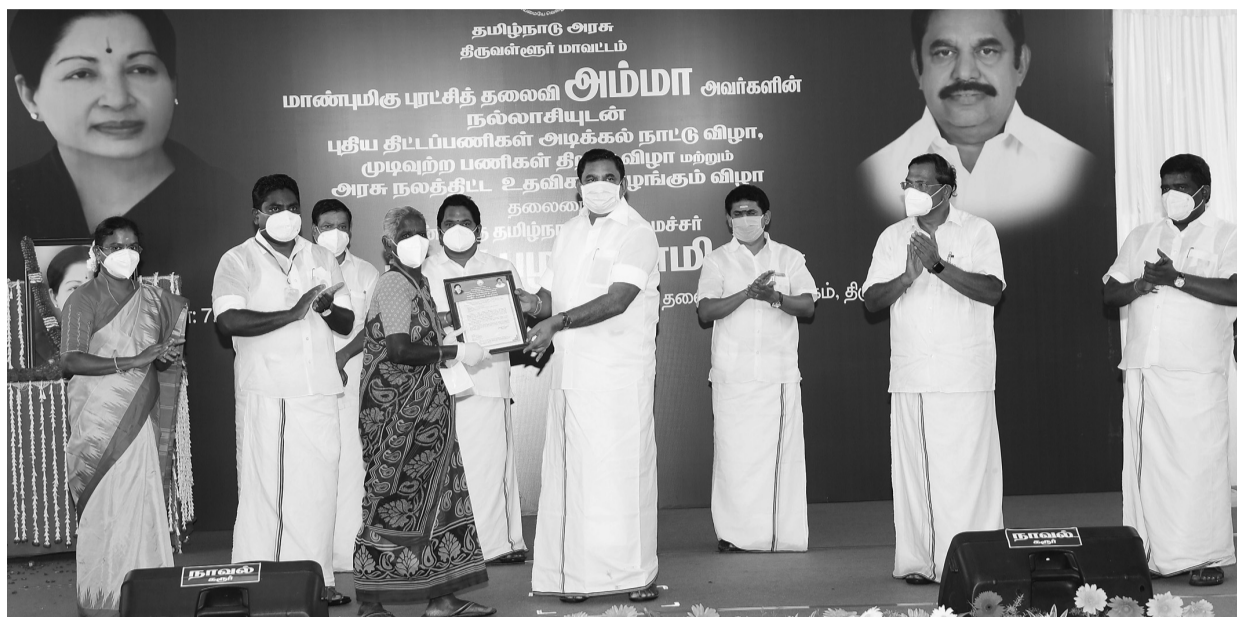
Chief Minister Palaniswami distributed welfare assistance to the beneficiaries under various welfare schemes of the Government at the function held at Tiruvallur district collectorate. Rural Industries Minister Benjamin, Tamil Culture Minister Pandiarajan, Tiruvallur collector Maheswari Ravikumar, MLAs were present at the function.