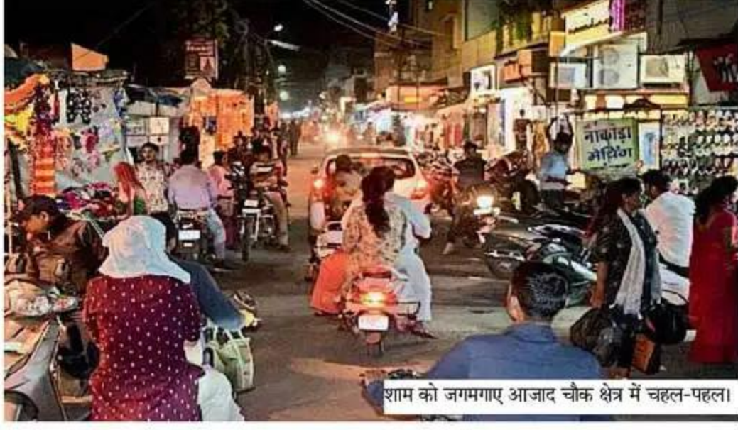
शाम को जगमगाए आजाद चौक क्षेत्र में चहल-पहल।

भास्कर संवाददाता | भीलवाड़ा त्योहारी सीजन के चलते दुकानों पर ग्राहकों की भीड़ हर दिन बढ़ रही है। नवरात्र में देवी व्रत में बाजारों पर कृपा बरसाई। अब दीपावली पर धन बरसने की आशा लेकर व्यापारियों में उत्साह है। करीब दो साल से कोरोना की मार झेल रहे बाजार में ग्राहकों बढ़ने से दुकानदारों के चेहरे पर खुशी लौट आई है। शहर के बाजारों में इस समय गारमेट, जूता-चप्पल, इलेक्ट्रॉनिक्स, आभूषण और ऑटो मोबाइल सहित अन्य सामानों की दुकानों में तरह-तरह के ऑफर चल रहे हैं। रेट में भी उपभोक्ताओं को