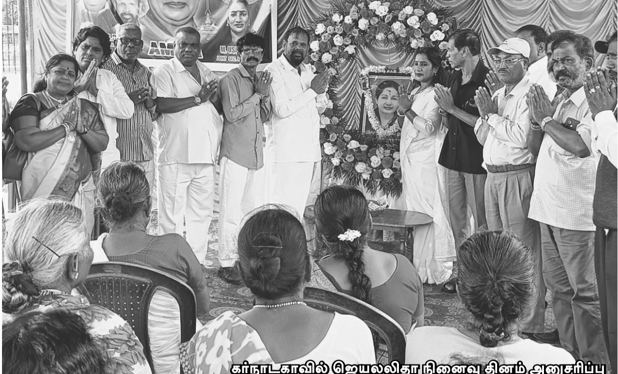
கர்நாடகாவில் ஜெயலலிதா நினைவு தினம் அனுசரிப்பு