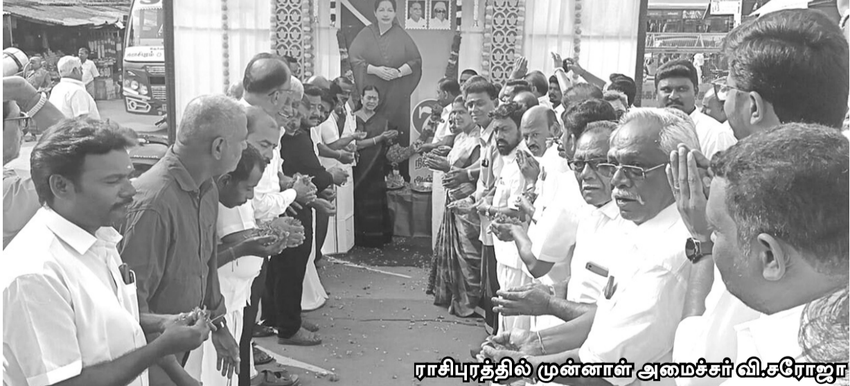
ராசிபுரத்தில் முன்னாள் அமைச்சர் வி.சரோஜா

மின்னணு வாக்குப்பதிவு முறையான தபால் முடிவுகள் ஜனவரி 8, 2024 அன்று காலை 9.00 மணிக்கு (இந்திய நேரப்படி) மிகாலம் அறிவிக்கப்படும். ஆயிரப்பாளர் அறிக்கையின் கூடிய வாக்குப் பதிவு முடிவுகள் பிஎஸ்டி லிமிடெட்டிற்கு தெரிவிக்கப்படும். அது கம்பெனியின் இணையதளம் www.kmchospitals.com-ல் பதிவேற்றம் செய்யப்படும். இயக்குனர்கள் குழு உத்தரவுப்படி ரா.பொன்மணிகண்டன் கம்பெனி செயலாளர்