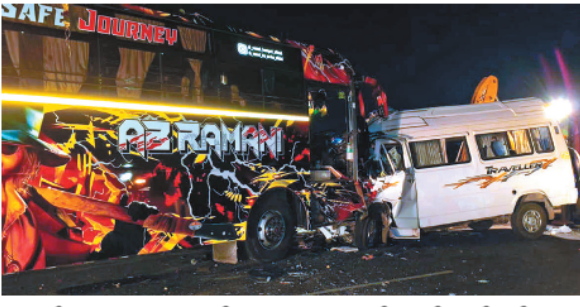
தேனி அருகே நேற்றிரவு ஏற்பட்ட விபத்தில் சிக்கிய பஸ் மற்றும் வேன்.