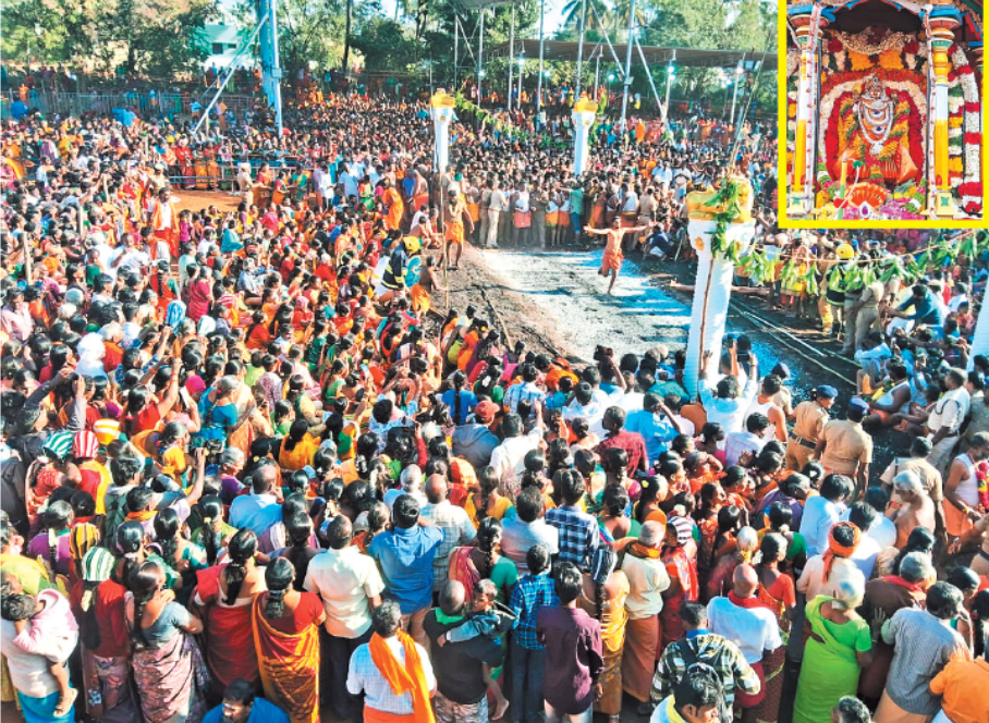
பொள்ளாச்சியை அடுத்த ஆனைமலை மாசானியம் கோயிலில் இன்று குண்டம் திருவிழா நடந்தது. இதில், குண்டம் இறங்குவதை காண திரண்டிருந்த பக்தர்கள். உள்பட: சிறப்பு அலங்காரத்தில் மாசானியம்மன்.

பொள்ளாச்சி, பிப். 14-ஆனைமலை மாசானியம்மன் கோயில் குண்டம் திருவிழா இன்று நடந்தது. இதில், குண்டம் இறங்குவதை காண திரண்டிருந்த பக்தர்கள். உள்பட: சிறப்பு அலங்காரத்தில் மாசானியம்மன். பொள்ளாச்சி, பிப். 14-ஆனைமலை மாசானியம்மன் கோயில் குண்டம் திருவிழா இன்று நடந்தது. இதில், குண்டம் இறங்குவதை காண திரண்டிருந்த பக்தர்கள். உள்பட: சிறப்பு அலங்காரத்தில் மாசானியம்மன். பொள்ளாச்சி, பிப். 14-ஆனைமலை மாசானியம்மன் கோயில் குண்டம் திருவிழா இன்று நடந்தது. இதில், குண்டம் இறங்குவதை காண திரண்டிருந்த பக்தர்கள். உள்பட: சிறப்பு அலங்காரத்தில் மாசானியம்மன்.