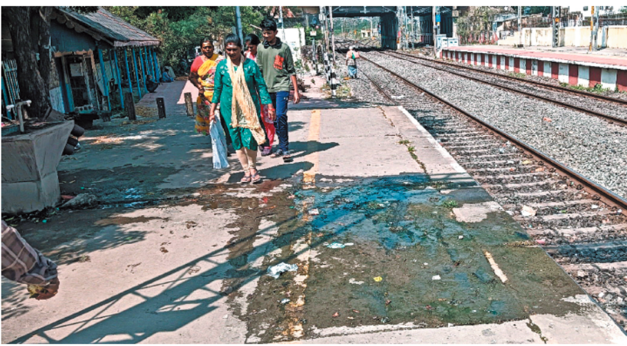
சென்னை வண்ணாரப்பேட்டை ரயில் நிலையத்தில் 1வது நடைமேடை சேறும் சக்தியுமாக காணப்படுகிறது. இதனால் பயணிகள் கடும் அவதிப்படுகின்றனர்.