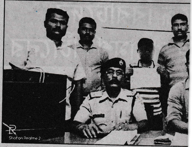
স্টাফ রিপোর্টার: উত্তর ভারতে এই সময় বিয়ের ২৭৬টি স্থানে অনুষ্ঠান চলে। তাছাড়াও স্কুল ছুটি থাকার কারণে ৩৭৮টি অবৈধ