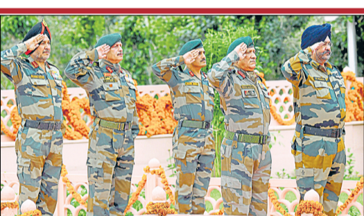
द्रास में विजय दिवस के मौके पर शहीद जवानों को श्रद्धांजलि देते सेना प्रमुख बिपिन रावत व अन्य।