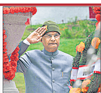
श्रीनगर स्थित युद्ध स्मारक पर शहीद जवानों को श्रद्धांजलि देते राष्ट्रपति रामनाथ कोविंद।

कश्मीर में छद्म युद्ध की आशंका व्यक्त करते हुए उन्होंने कहा कि सेना को आधुनिक निगरानी उपकरणों से