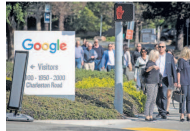
Australia would form a special branch of the ACCC, the country's antitrust watchdog, to scrutinize how the firms used algorithms to match advertisements with viewers.

Australia said it would establish the world's first dedicated office to police Facebook Inc. and Google as part of reforms designed to rein in the US technology giants, potentially setting a precedent for global lawmakers. The move tightens the regulatory screws on the online platforms, which have governments from the US to Europe scrambling to address concerns ranging from antitrust issues to the spread of "fake news" and hate speech.