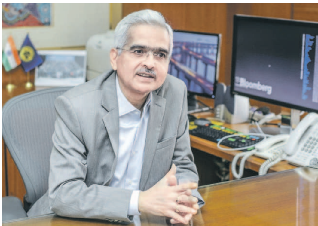
Reserve Bank of India governor Shaktikanta Das.

"The global order today faces several challenges that will test the skills of the international organizations, as well as those of national monetary and fiscal authorities. International coordination has