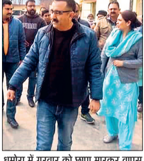
धमौरा में गुरुवार को छापा मारकर वापस लौटती ईडी की टीम।