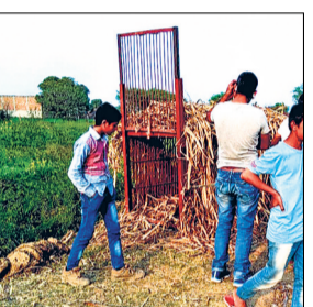
गुन्नौर के गांव में तेंदुआ पकड़ने को लागाया गया पिंजरा।