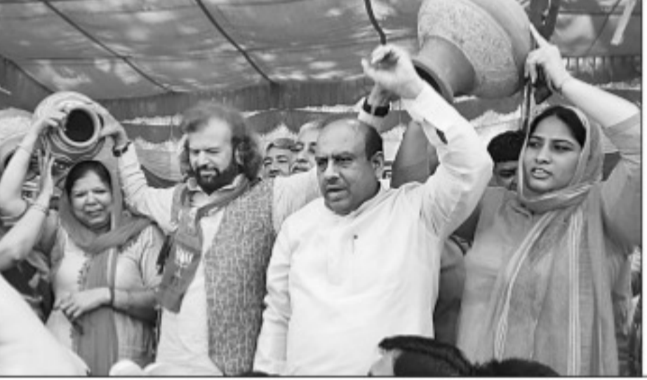
नरेला विधानसभा में जल संकट को लेकर गुरुवार को मटका फोड़ प्रदर्शन में भाग लेते प्रदर्शन उत्तर-पश्चिम दिल्ली के सांसद हंसराज हंस और विपक्ष के नेता विजेंद्र गुप्ता।