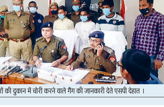
सुनारों की दुकान में चोरी करने वाले गैंग की जानकारी देते एसपी देहात ।