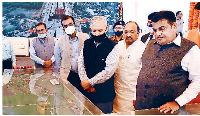
निरीक्षण के दौरान नक्शा देखते हुए अधिकारियों के साथ मंत्री नितिन गडकरी

9 हजार करोड़ रूपए की लागत से बन रहा एक्सप्रेस-वे