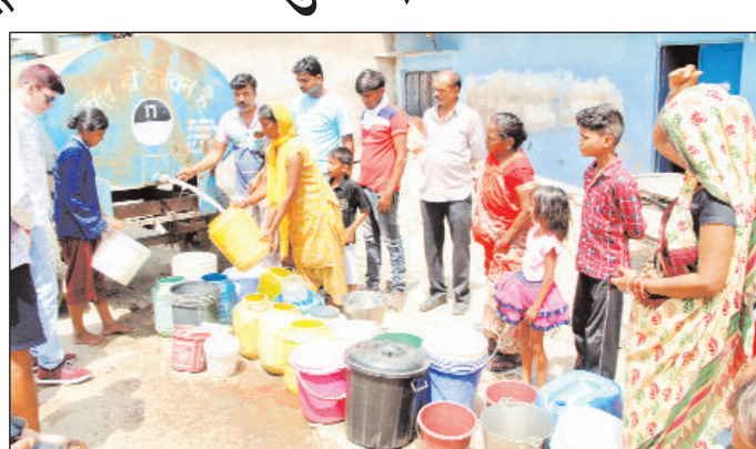
जूही राखीमंडी में टैंकर से पानी भरते लोग।

बारादेवी में लगे नलकूप की मोटर शनिवार शाम को फुंकी गई थी। इससे बारादेवी, जूही हमीरपुर रोड, धोबी तालाब, राखी मंडी, संत रविदास नगर सहित एक दर्जन से अधिक क्षेत्रों में जलापूर्ति नहीं हो सकी। सोमवार को भी लोगों को दूसरों के घरों में लगे सबमर्सिबल पम्पों का सहारा