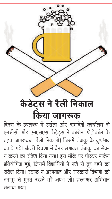
कैडेट्स ने रैली निकाल किया जागरूक