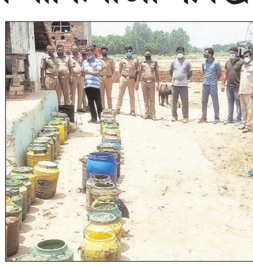
नर्वल में पकड़ी गई शराब भंडी व शराब से भरे डिब्बे।

नकली शराब और कच्ची शराब बनाने वालों के खिलाफ सोमवार को पुलिस और जिला प्रशासन की टीम ने अभियान छेड़ा। इस अभियान के तहत पूरे शहर में शराब की दुकानों में रहने चेंकिंग की गयी। अभियान के दौरान पुलिस ने अवैध शराब का कारोबार करने वाले 25 लोगों को गिरफ्तार कर उनके खिलाफ रिपोर्ट दर्ज कर उन्हें जेल भेजा। वहीं पुलिस की एक टीम ने मुखबिर् की सूचना पर नर्वल के पाली गांव में दबिश दी। वहां गांव बाहर एक तालाब किनारे महिला कच्ची शराब बनाने की भंडी लगाये हुए थी। पुलिस ने उसकी भंडी तोड़ दी, लेकिन उसे शराब बनाने का कच्चा माल लहने नहीं मिला। इस