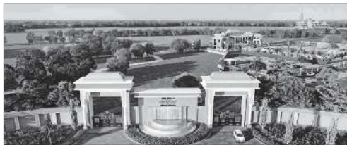
FPI NEWS SERVICE / Mumbai

Property registrations in Ayodhya district have spiked by 120% between 2017 and 2022