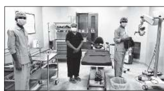
36 more surgeries lined up at the facility between Mira Road and Dahanu

Over a month after the state government run-Bharat Katarik Bhimsen Joshi Civil (Tombha) Hospital in Bhayandar started conducting cataract surgeries, 36 patients have been successfully treated at the sole free-for-all facility which is available between Mira Road and Dahanu. The surgeries were performed with the help of a high-end laser phacoemulsification, a modern approach widely followed by private eye care hospitals. Apart from hi-tech equipment, the hospital has its own team of qualified ophthalmologists. The average cost of conducting the cataract surgery in a private eye care cen-