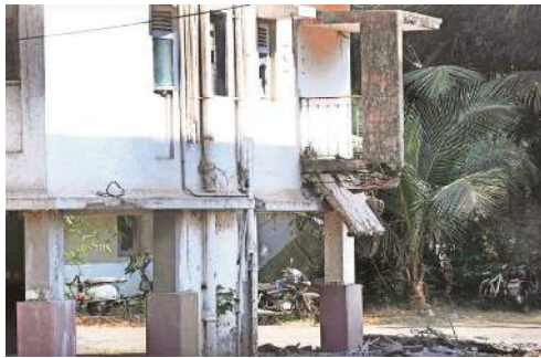
The Air India Colony is spread over a 184-acre land parcel and houses 350 families who were employed with the airline. Express

The MIAL is seeking this land for expansion of the airport. The land on which this colony is built was owned by the state government and leased to the Airports Authority of India which had given the land to Air India. With