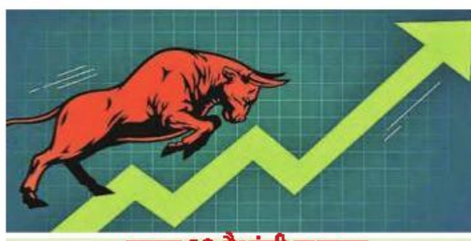
रुपया ६२ पैशांनी वधारला

मुंबई: जागतिक पातळीवर प्रमुख भांडवल बाजारातील तेजीचे पडसाद देशांतर्गत बाजारवार उमटत शुक्रवारी प्रमुख निर्देशांक सेन्सेक्स आणि निफ्टी प्रत्येकी २ टक्क्यांनी वधारले. गुंतवणूकदारांनी माहिती तंत्रज्ञान, धातू आणि वित्त कंपन्यांच्या समभागामध्ये जोरदार खरेदी केली. अमेरिकेतील महागाई अपेक्षेपेक्षा अधिक नरमल्याने जगभरात तेजीचे वारे संचाले. अमेरिकी डॉलरच्या तुलनेत सलग चार सत्रात एक रुपयाहून अधिक मजबूत झालेले स्थानिक चलन आणि परदेशी गुंतवणूकदारांकडून अखंड सुरु राहिलेली खरेदी आणि भांडवलाच्या ओघामुळे बाजारात उत्साहाचे वातावरण होते.