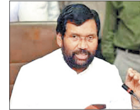
कहा, प्याज की जमाखोरी पर रखी जा रही है कड़ी नजर

करेंगे। मांगें नहीं मांगने पर वे सात दिसंबर को राष्ट्रीय राजधानी दिल्ली में रास्ता रोकी आंदोलन शुरू करेंगे। समिति का दावा है कि करीब 65 लाख ईपीएस पेंशनभोगी उनके साथ जुड़े हैं। मूल वेतन का 12 फीसदी उल्लेखनीय है कि ईपीएस, 95 के तहत आने वाले कर्मचारियों को उनके मूल वेतन का 12 प्रतिशत हिस्सा भविष्य निधि में जाता है। वहीं, नियोजता के 12 प्रतिशत हिस्से में से 8.33 प्रतिशत कर्मचारी पेंशन योजना में जाता है। इसके अलावा पेंशन कोष में सरकार भी 1.16 प्रतिशत का योगदान करती है।