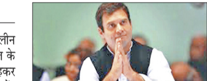
सुको ने पूरी की सुनवाई, कभी भी सुनाया जा सकता है निर्णय

लोकसभा चुनाव के प्रचार के दौरान तत्कालीन कांग्रेस अध्यक्ष राहुल गांधी ने सत्तारूढ़ दल के प्रधानमंत्री नरेंद्र मोदी को चौकीदार चोर है कहकर संबोधित किया था। इससे पहले प्रधानमंत्री नरेंद्र मोदी ने चुनाव के दौरान अपने को देश का चौकीदार बताया था। इसी पर अपनी प्रतिक्रिया व्यक्त करते हुए राहुल गांधी ने कहा था कि चौकीदार ही चोर है जिस पर उनके खिलाफ केस फाइल किया गया था। मुख्य न्यायाधीश रंजन गोगोई की अध्यक्षता वाली तीन सदस्यीय पीठ ने दोनों पक्षों की दलीलों सुनने के बाद राहुल गांधी के खिलाफ दाखिल याचिका पर फैसला सुनिश्चित रख लिया जो कभी भी सुनाया जा सकता है।