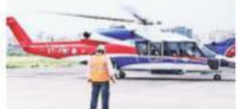
S-76D uses 5th generation technology.

The helicopter is fitted with Enhanced Ground Proximity Warning System (EPGWS), TCAS and AIS transponder and has advance glass cockpit.