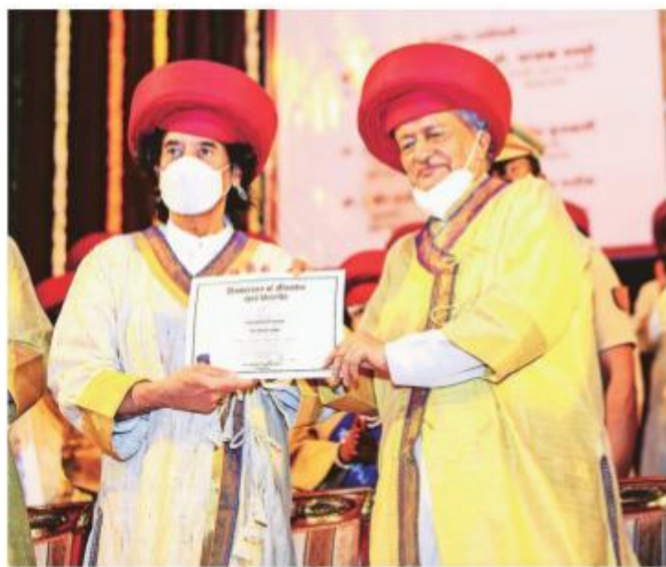
Governor Bhagat Singh Koshyari felicitates Ustad Zakir Hussain at MU's Fort campus on Thursday.