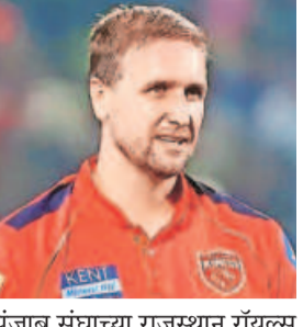
पंजाब संघाच्या राजस्थान रॉयल्स (१५ मे) आणि सरनायजर्स हैदराबाद (१९ मे) या संघांविरुद्धच्या 'आयपीएल' सामन्यांसाठी उपलब्ध नसेल. लिव्हिंगस्टोनची दुखापत गंभीर नसली, तरी पाकिस्तानविरुद्ध ट्वेन्टी-२० मालिकेपूर्वी त्याने आपल्या दुखापतीवर उपचार घ्यावे अशी इंग्लंडच्या व्यवस्थापनाची इच्छा आहे. ट्वेन्टी-२० विश्वचषकासाठी इंग्लंड संघात निवड झालेले मोईन अली (चेन्नई सुपर किंग्ज), संम करन आणि जॉनी बेअरस्टो (दोघे पंजाब किंग्ज), फिल सॉल्ट (कोलकाता नाइट रायडर्स) हे खेळाडूही लवकरच 'आयपीएल' सोडून मायदेशी परतणार आहेत.

पंजाब किंग्ज संघाचे १२ सामन्यात केवळ आठ गुण असून 'प्ले-ऑफ'च्या शर्यतीतून ते बाद झाले आहेत. त्यामुळे लिव्हिंगस्टोन मायदेशी परतल्याचा त्यांना फारसा फटका बसणार नाही. जोस बटलर (राजस्थान रॉयल्स), विल जॅक्स आणि रिस टॉपली (दोघे रॉयल चॅलेंजर्स बंगळूरु) हे इंग्लंडचे खेळाडूही मायदेशी परतले आहेत. ट्वेन्टी-२० स्पर्धेचे 'आयपीएल'मधील आव्हान शाबूत असल्याने त्यांची कमी या संधींना जाणवेल. इंग्लंडचा संघ २२ मेपासून पाकिस्तानविरुद्ध ट्वेन्टी-२० मालिका खेळणार आहे. त्यामुळे हे खेळाडू आता इंग्लंड संघात दाखल होतील. अर्थातच, लिव्हिंगस्टोन आता