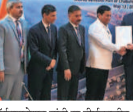
आर्गनायझेशन यांनी या दीर्घकालीन करारावर स्वाक्षरी केली, असे सरकारने अधिकृत निवेदनात म्हटले आहे. बंदराचे विकसन आणि संचालनासाठी आयपीजीएल सुमारे १२ कोटी अमेरिकी डॉलर गुंतवणूक करेल, तर आणखी २५ कोटी डॉलरचा निधी कर्जरूपात उभारला जाईल. भारताचे बंदरे व जलमार्गमंत्री सर्वानंद सोनोवाल आणि इराणचे वाहतूक आणि शहरी विकासमंत्री

व्यापार तसेच सामरिकदृष्ट्या महत्त्वाच्या इराणमधील चाबहार बंदराचे संचालन करण्यासाठी १० वर्षांच्या करारावर भारताने सोमवारी स्वाक्षरी केली, यामुळे मध्य आशियाशी व्यापार वाढविण्यास देशाला मदत होईल. या माध्यमातून भारताकडून प्रथमच विदेशी बंदराचे व्यवस्थापन हाती घेतले जाणार आहे. पाकिस्तानच्या हद्दीत न शिरता आंतरराष्ट्रीय उत्तर-दक्षिण वाहतूक कॉरिडॉर नावाच्या क्षेत्रातून रस्ते आणि रेल्वे मार्गाचा वापर करून भारतीय मालाला अफगाणिस्तान आणि मध्य आशियापर्यंत पोहोचण्यासाठी हे बंदर प्रवेशद्वार ठरेल. इंडियन पोर्ट्स ग्लोबल लिमिटेड (आयपीजीएल) आणि इराणच्या पोर्ट अँड मेरिटाइम