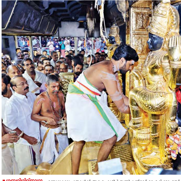
= ശബരിഗിരിനാഥാ... മണ്ഡലകാല പൂജകൾക്ക് ആരംഭം കുറിച്ച് തന്ത്രി കണ്ഠരര് മഹേഷ് മോഹനര് ശബരിമല നട തുറക്കുന്നു മംഗളം