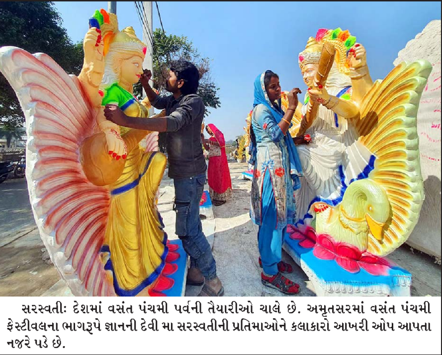
સરસ્વતી: દેશમાં વસંત પંચમી પર્વની તૈયારીઓ ચાલે છે. અમુતસરમાં વસંત પંચમી ફેસ્ટીવલના ભાગરૂપે જ્ઞાનની દેવી મા સરસ્વતીની પ્રતિમાઓને કલાકારો આખરી ઓપ આપતા નજરે પડે છે.

જમ્મુ, તા. ૧૦ પાકિસ્તાનમાં સામાન્ય ચુંટણીઓ પર, ડેમોક્રેટિક પ્રોગ્રેસિવ આજાદ પાર્ટી (ડીપીએપી) ના પ્રમુખ ગુલામ નબી આજાદે કહ્યું, "... દેશો વચ્ચેના તણાવ માટે પાકિસ્તાન જવાબદાર છે. પરંતુ નાગરિકો નિર્દોષ છે. અમારા નસીબમાં લોકશાહી હતી પરંતુ તેમના નસીબમાં સરમુખત્યાર હતા. સેના ત્યાં સરકારો ચલાવે છે. જો કોઈ ચૂંટાયેલ પ્રતિનિધિ દેખાય તો પણ તે આર્મીની દયા પર હોય છે. જ્યારે પણ સેનાને લાગ્યું કે વ્યક્તિ તેમને અનુસરી રહી નથી ત્યારે તેઓને (સત્તા પરથી) હાંકી કાઢવામાં આવ્યા હતા. અમે મુક્ત અને નિષ્પક્ષ ચૂંટણીની આશા રાખી હતી. પરંતુ તેઓએ અહીં પણ દખલગીરી કરી... અમે, ભારતમાં, ભાગ્યશાળી છીએ કે સંસદસભ્યો અને ધારાસભ્યોને ચૂંટવામાં આર્મી દખલ કરતી નથી. દુનિયાભરની લોકશાહીમાં આવું જ થાય છે. પાકિસ્તાનના લોકો માટે પ્રાર્થના કરો કે કોઈ દિવસ આપણા જેવી લોકશાહી મળે."