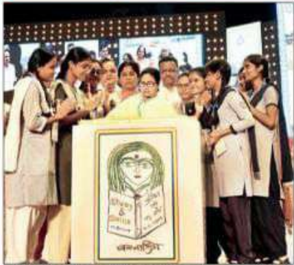
কলকাতা শিবিরে হারিয়ে যাওয়া সন্তানকে ফিরিয়ে আনা নিয়ে স্মরণীয় মুহূর্তের একটি ছবি।